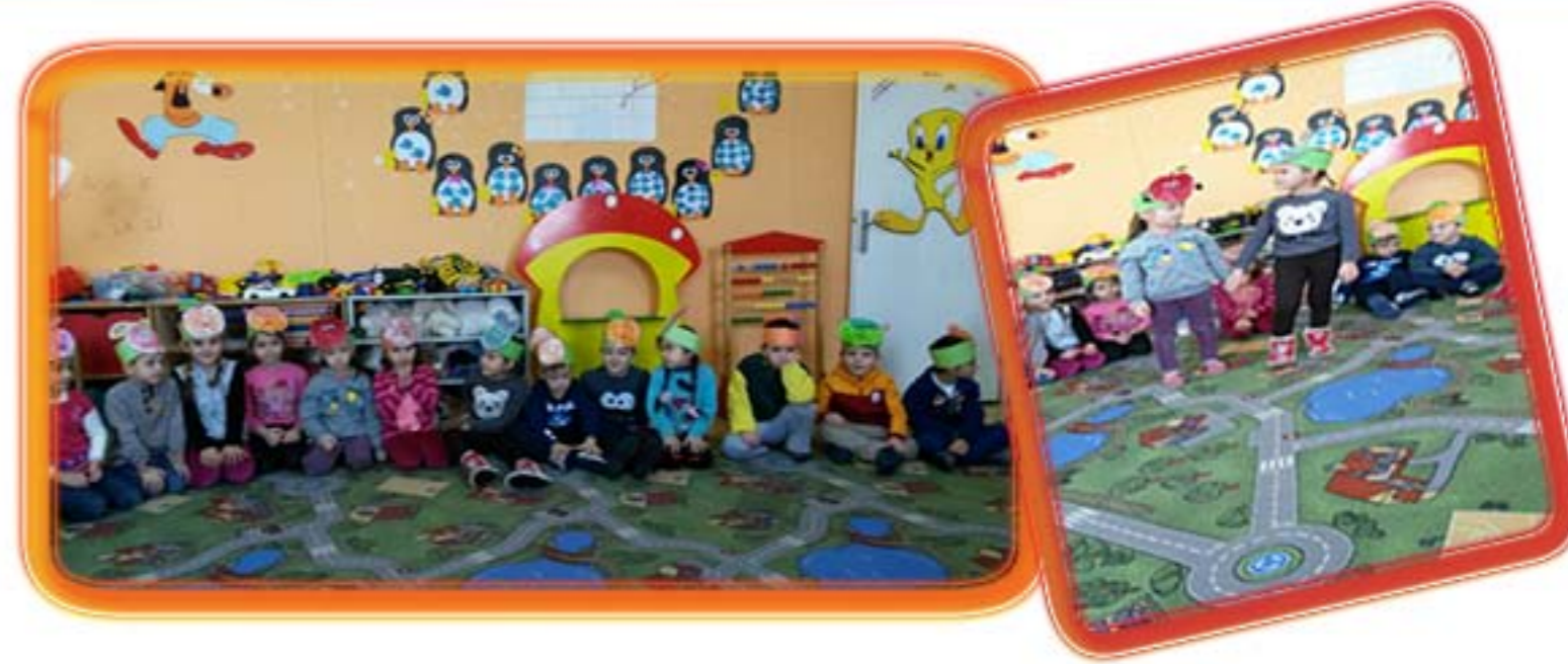
Tutum Yatırım ve Türk Malları Haftası kapsamında hafta boyunca okulumuzda sürdürülen faaliyetler