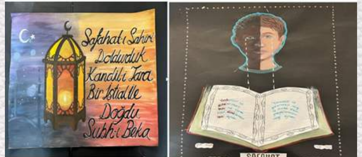
II İkinci Betül TAŞ Güzel Sanatlar Lisesi