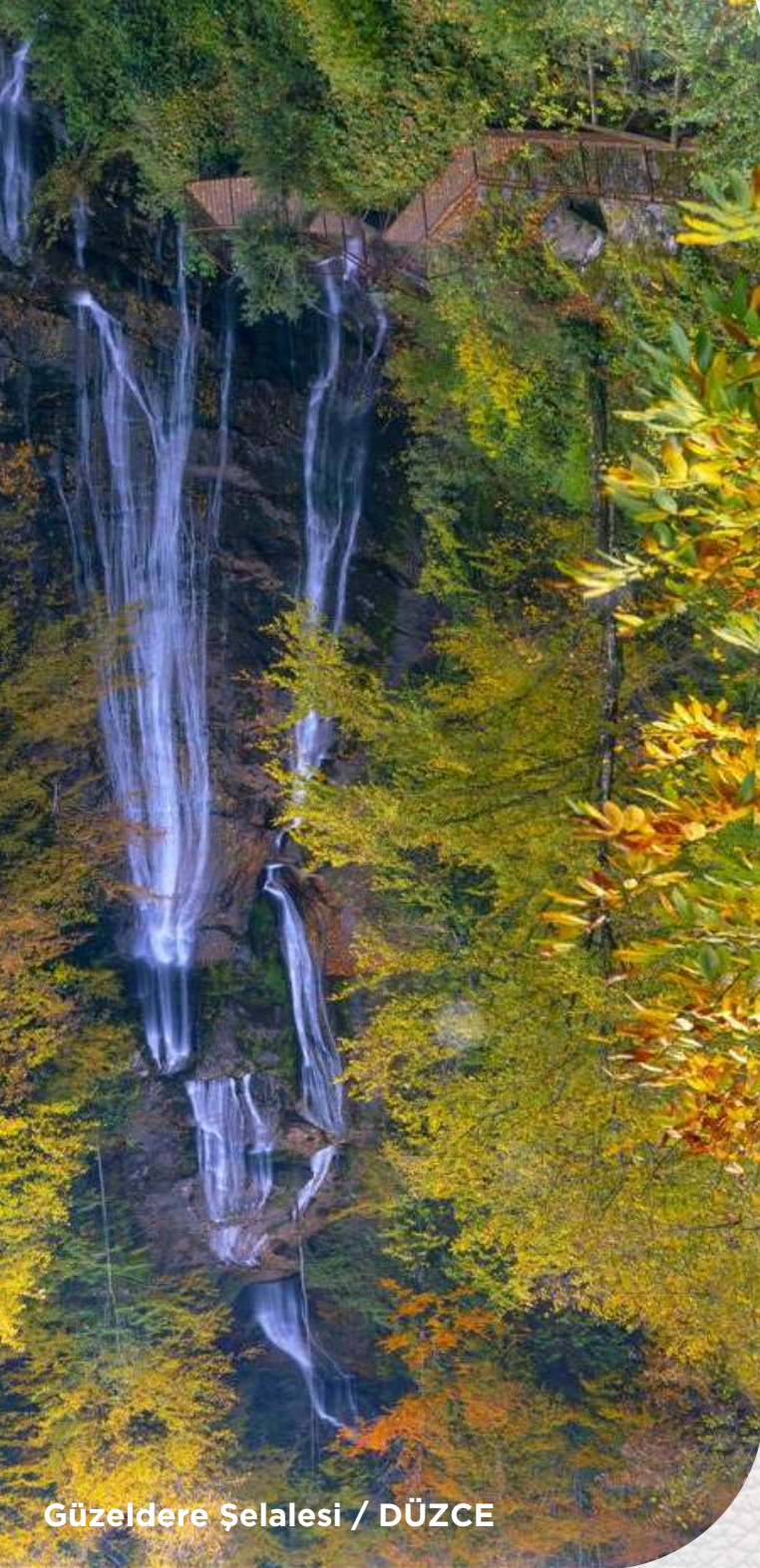
Güzeldere Şelalesi / DÜZCE