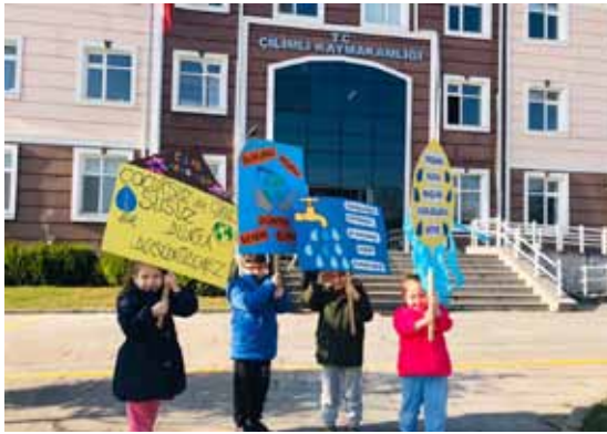
KARDEŞ OKULLAR TEMİZ SU KULLANIMI İÇİN YÜRÜDÜLER